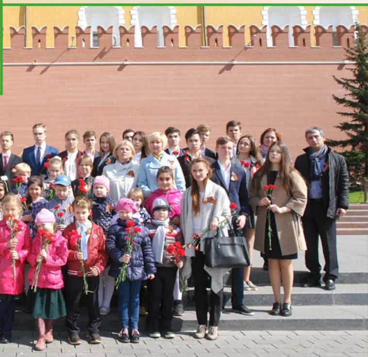
Общая фотография у Вечного огня.