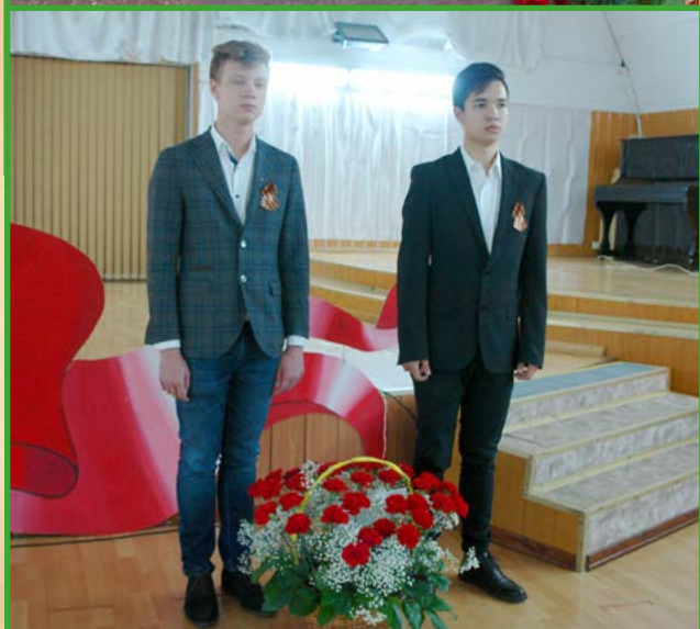
Красные гвоздики – символ Победы.