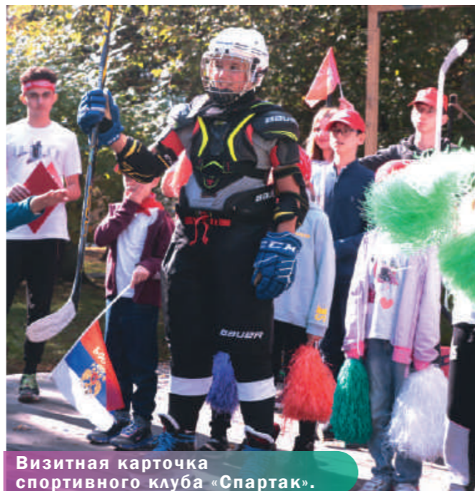
Визитная карточка спортивного клуба «Спартак».