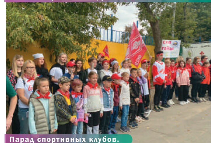
Парад спортивных клубов.

Солнечной и теплой погодой встретил участников игры оздоровительный комплекс «Салют» в поселке Володарского. Визитные карточки спортивных клубов показали их обаяние и остроумие, способности и талант, трудолюбие и умение подать себя.