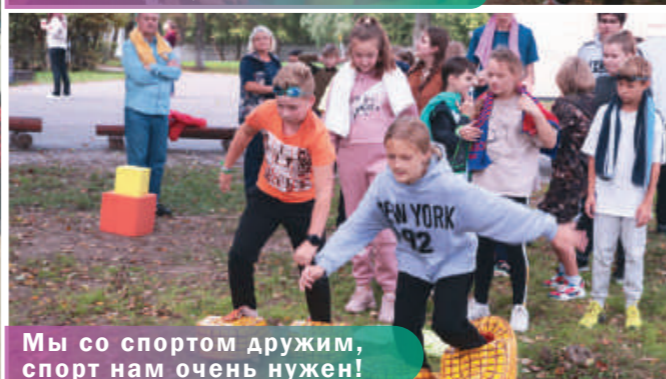
Мы со спортом дружим, спорт нам очень нужен!