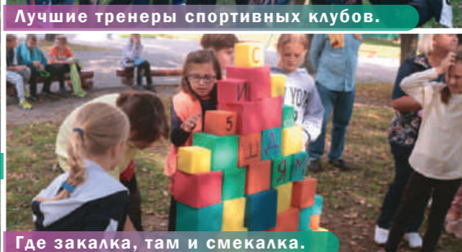
Где закалка, там и смекалка.