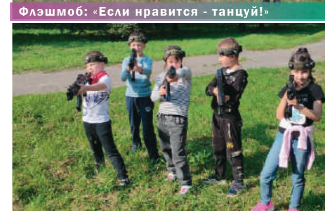
Лазертаг объединяет, за это мы его любим!