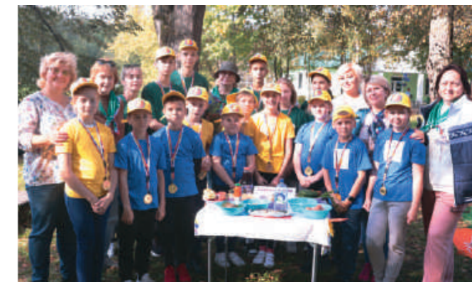
Мы знаем правила питания чемпионов!

Где еще можно испытать столько эмоций, как не на спортивном состязании? Здесь и радость победы, и грусть поражения, страх перед новыми испытаниями и удивление своим возможностям, по-хорошему, спортивная злость, если что-то не получилось, и счастье, когда удастся перебороть страх и побе-