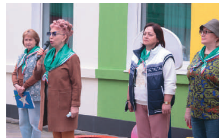
Слова напутствия от руководителей школы.