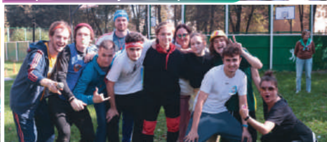
Лучшие тренеры спортивных клубов.