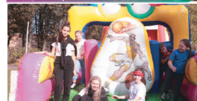
Прыжки на батуте приносят не только удовольствие, но и пользу физическому здоровью.