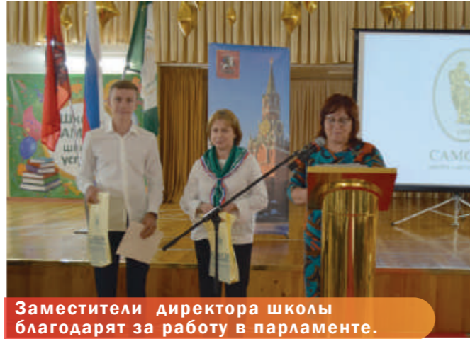
Заместители директора школы благодарят за работу в парламенте.

В целях воспитания патриотического сознания, привития любви к своей Родине в школе прошла неделя, посвященная 60-летию полета Ю.А. Гагарина в космос. Секторы культуры и образования устроили для всех настоящий праздник: поэтические перемены, показ доку-