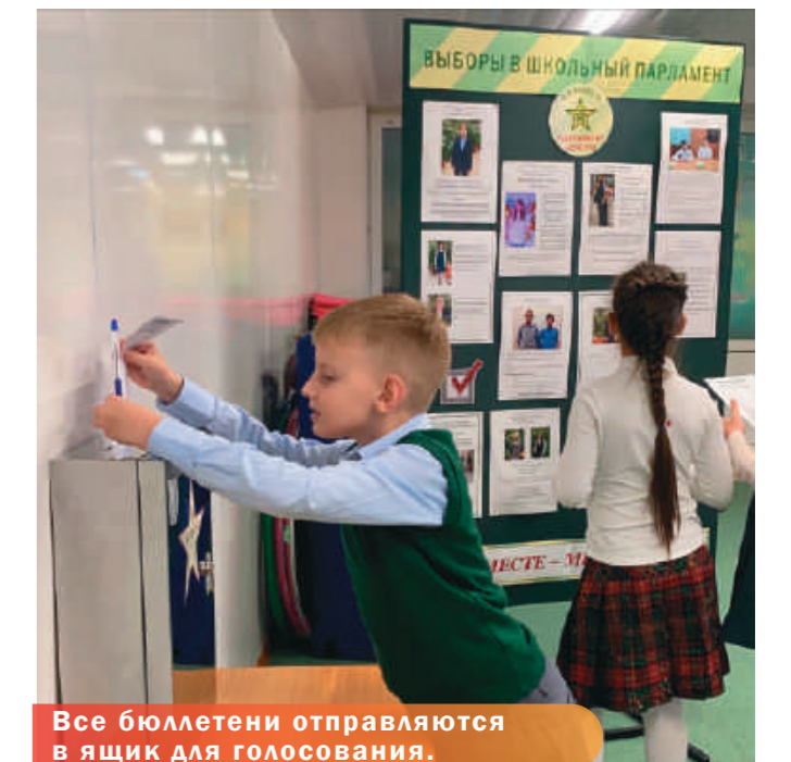
Все бюллетени отправляются в ящик для голосования.