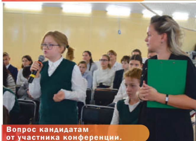
Вопрос кандидатам от участника конференции.