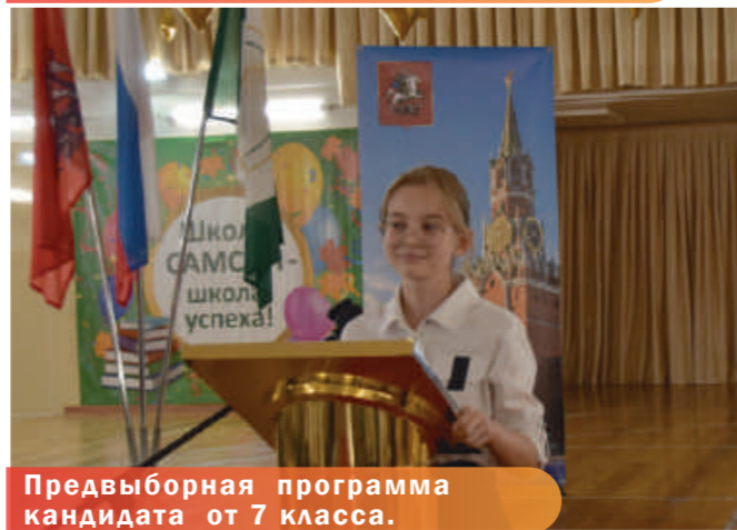
Предвыборная программа кандидата от 7 класса.