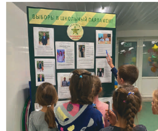
Избиратели 2-х классов изучают предвыборные программы кандидатов.

В конце сентября прошла акция «Книга ищет читателей». Ребятам было предложено принести из домашней библиотеки книги, которые за ненадобностью пылятся на полках. Позже все собранные книги были переданы в магазин на ул. Покровка, где для них нашли новых читателей.