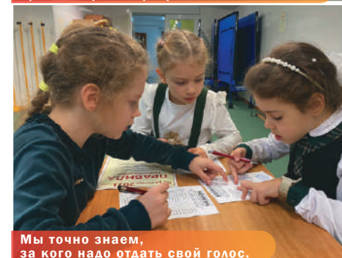
Мы точно знаем, за кого надо отдать свой голос.