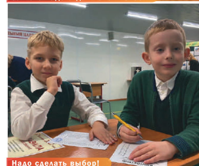
Надо сделать выбор!