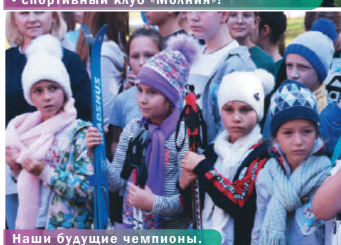
Наши будущие чемпионы.