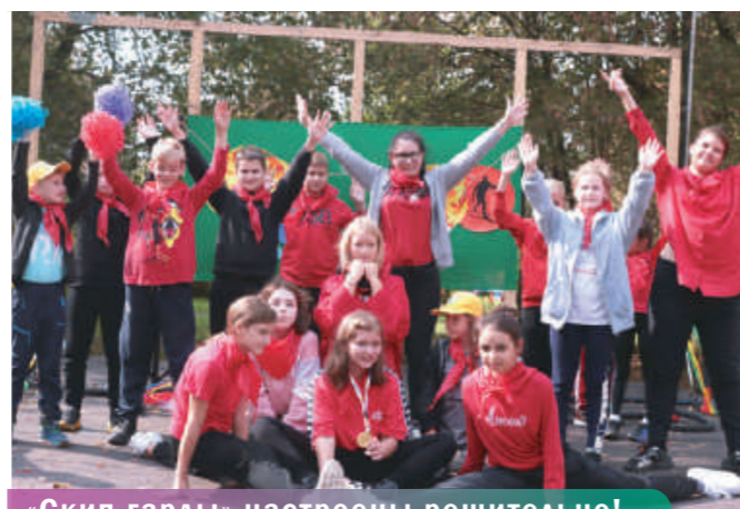
«Скип гарды» настроены решительно!