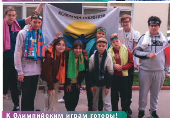
К Олимпийским играм готовы!