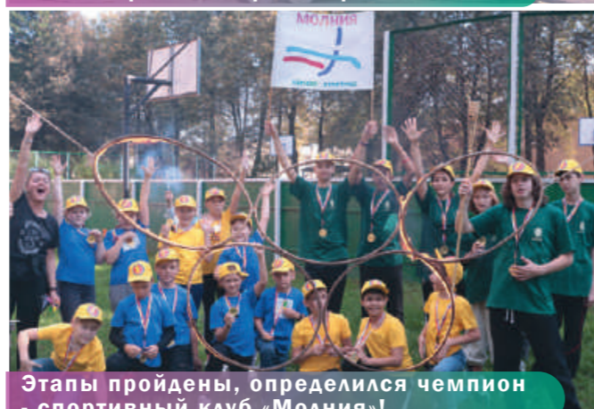
Этапы пройдены, определен чемпион – спортивный клуб «Молния»!