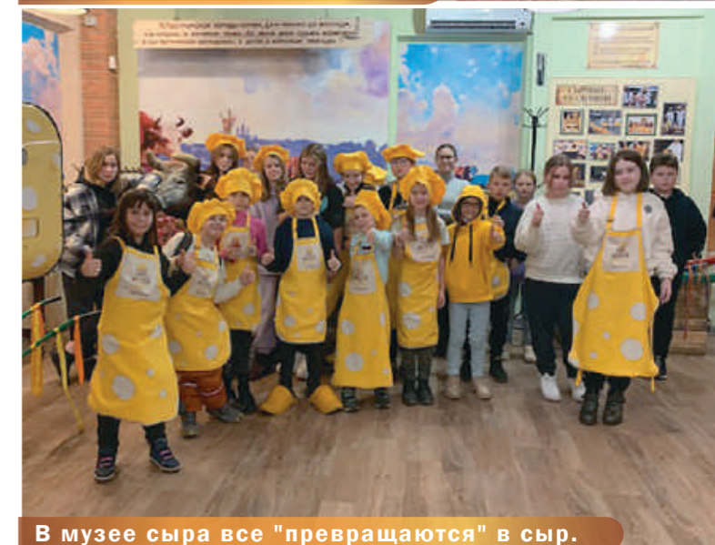
В музее сыра все "превращаются" в сыр.