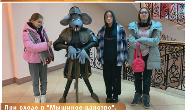
При входе в "Мышиное царство".