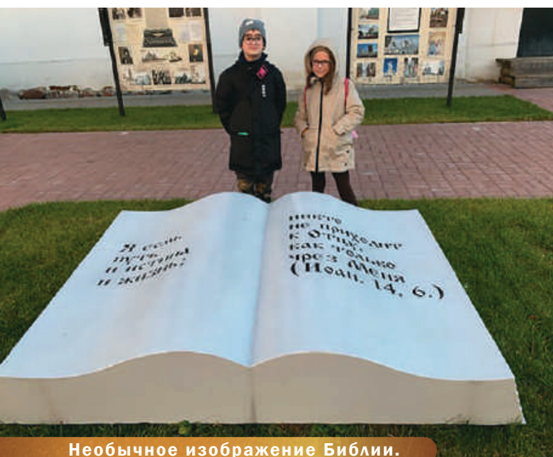
Необычное изображение Библии.