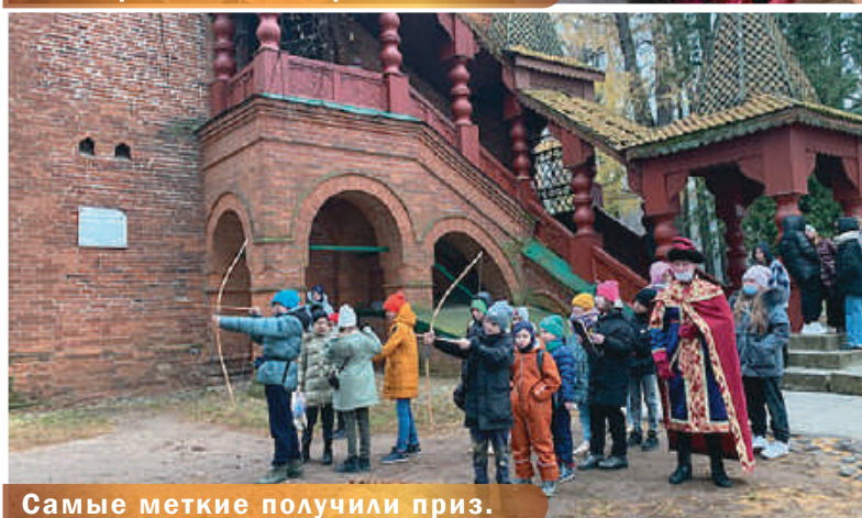
Самые меткие получили приз.