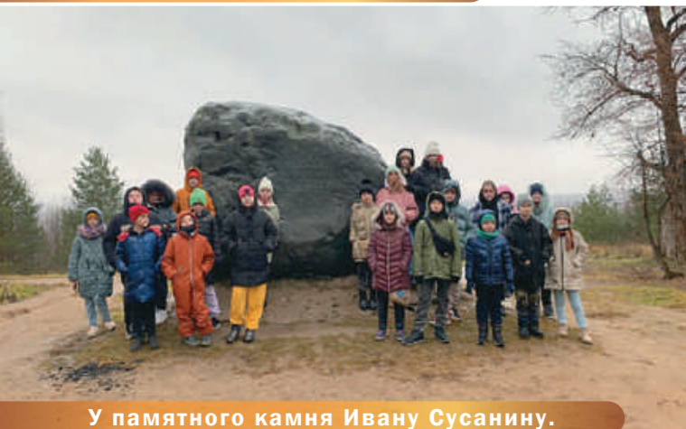
У памятного камня Ивану Сусанину.