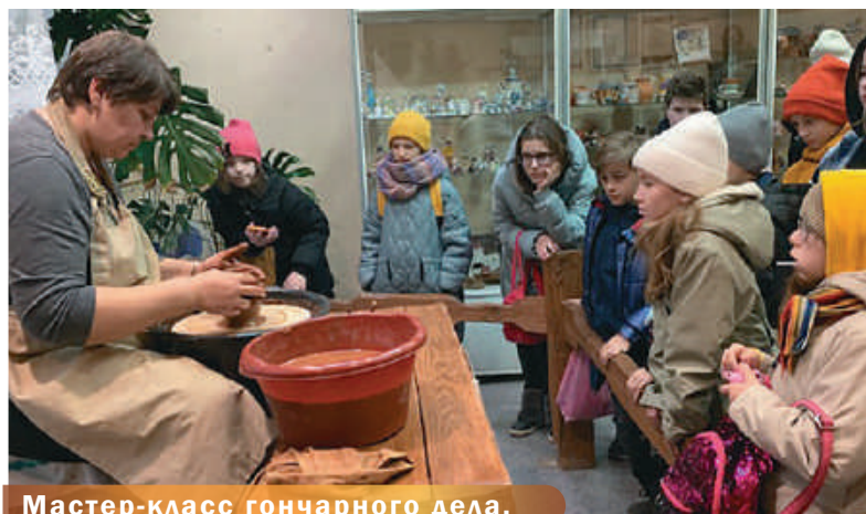
Мастер-класс гончарного дела.