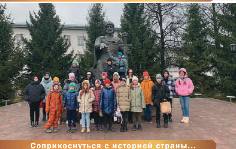
Соприкоснуться с историей страны...