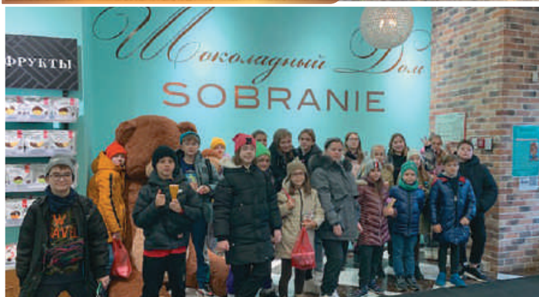
Это просто сказочный детский рай!