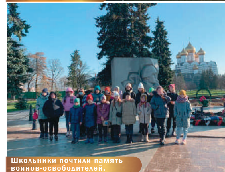
Школьники почтили память воинов-освободителей.