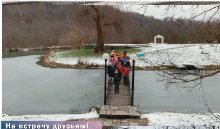
На встречу друзьям!