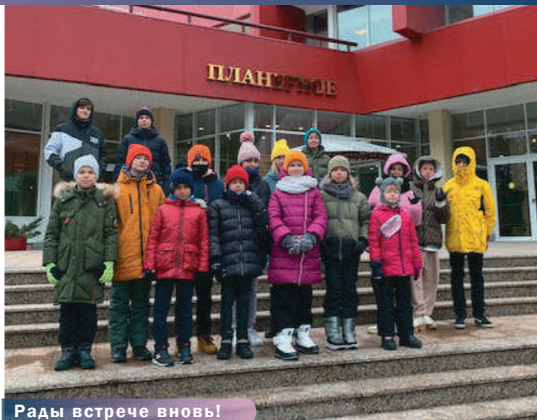
Рады встрече вновь!

Каждый день в лагере начинался с зарядки в спортивном зале. «В здоровом теле – здоровый дух!» - мы старались следовать этому девизу. Затем детей ждал вкусный завтрак в уютном и комфортабельном ресторане. Меню ресторана удивляло своим разнообразием. В рационе присутствовали фрукты, овощи, соки. Питание было четырехразовым в формате «шведский стол», что очень нравится детям.