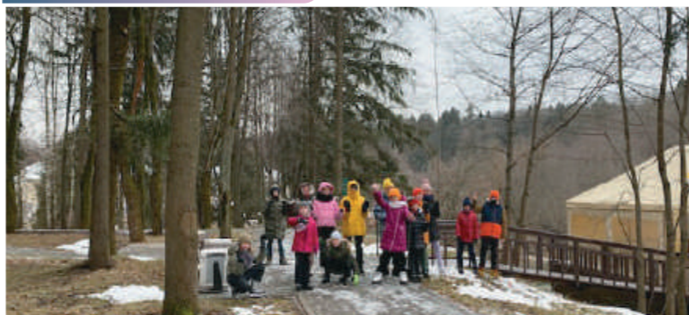
Мы раскрасили осенний пейзаж.