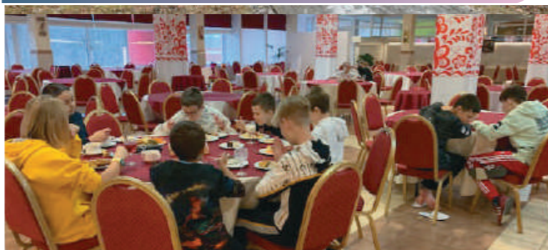
После прогулки обед ещё вкуснее.