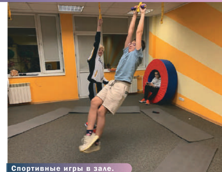
Спортивные игры в зале.