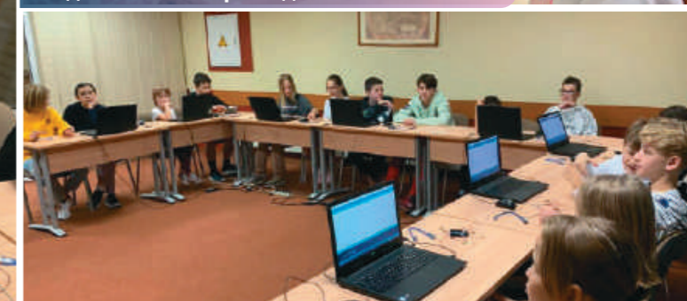
Дружная работа в компьютерном классе.