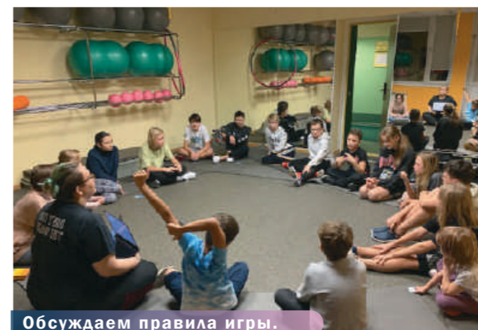
Обсуждаем правила игры.