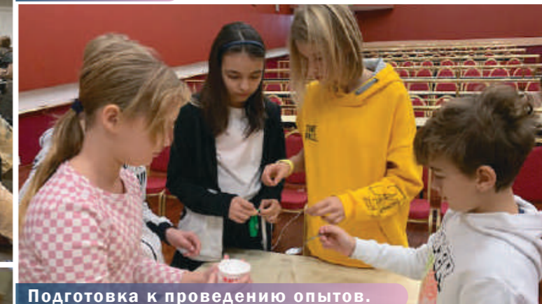
Подготовка к проведению опытов.