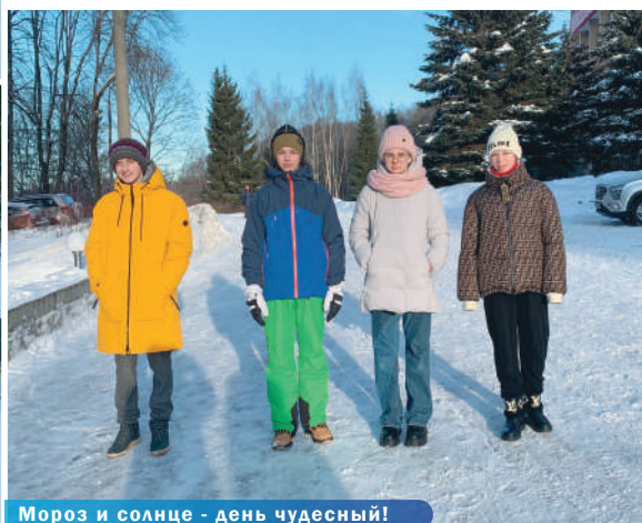
Мороз и солнце - день чудесный!

Каникулы длинные, и именно в это время очень хочется найти возможность пообщаться с друзьями и одноклассниками. Поездка на отдых в Подмоскowie порадовала детей. Школа «САМСОН» уже многие годы предлагает ребятам отдых в пансионате «Планерное». В этом живописном месте можно встретить белочек, зайцев и даже следы лис. Вся территория отеля выглядит как первозданный лес, и лишь ухоженные дорожки выдают руку заботливого хозяина. Богатый ассортимент блюд, предлагаемый работниками ресторана, дополнял тёплую домашнюю обстановку. В Рождественский вечер на ужин была запечённая утка с яблоками, совсем как дома!