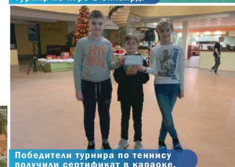
Победители турнира по теннису получили сертификат в караоке.