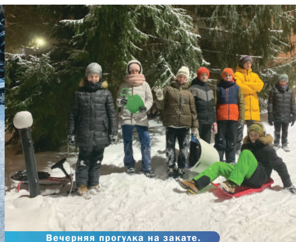
Вечерняя прогулка на закате.

Каждый день отдыха был интересен, хотя и соблюдался режим дня: зарядка, завтрак, спортивные мероприятия, прогулка на свежем воздухе, обед, тихий час, развлекательные игры, полдник, прогулка, ужин, вечерняя анимация, дискотека, вечерний туалет и сон. Однако игры и квесты каждый раз были разные и очень весёлые. Но самое любимое занятие ребят было катание на снежных горках! Все с удовольствием соревновались, катались паровозиком, и просто съезжали с горки, пока она не занята никем, на большой скорости. Строили башни и крепости изо льда, а потом защищали подступы к ним. И, конечно же, было время для свободного общения, для разговоров «по душам», для теплых бесед с педагогами. Для летей это очень важно.