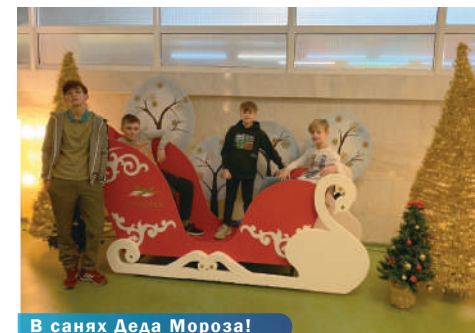
В санях Деда Мороза!