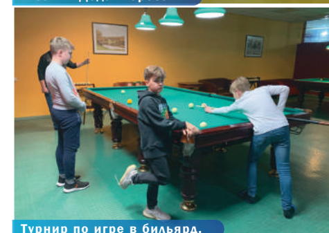
Турнир по игре в бильярд.