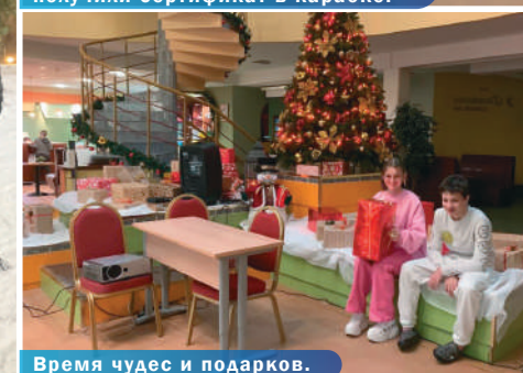
Время чудес и подарков.