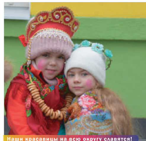
Наши красавицы на всю округу славятся!