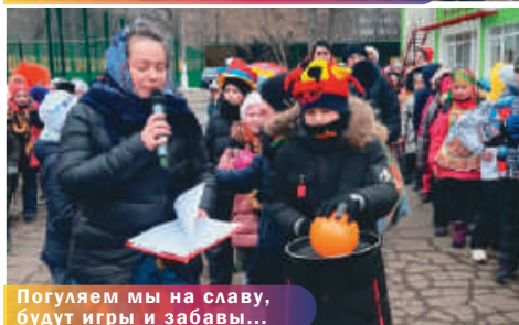
Погуляем мы на славу, будут игры и забавы...