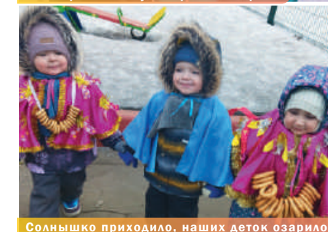
Солнышко приходило, наших деток озарило!