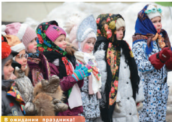
В ожидании праздника!