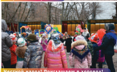
Честной народ! Приглашаем в хоровод!