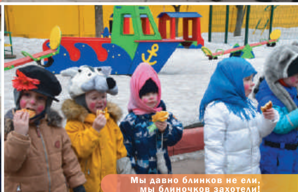
Мы давно блинков не ели, мы блинчиков захотели!