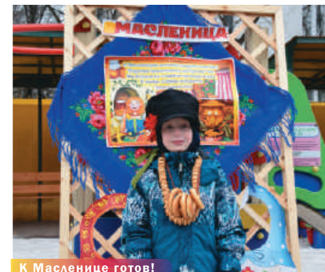
К Масленице готов!