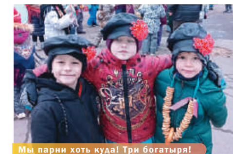
Мы парни хоть куда! Три богатыря!