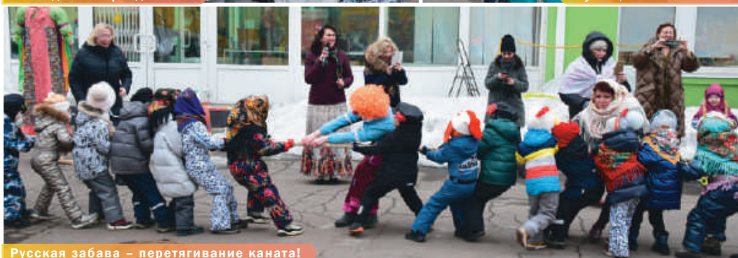
Русская забава – перетягивание каната!