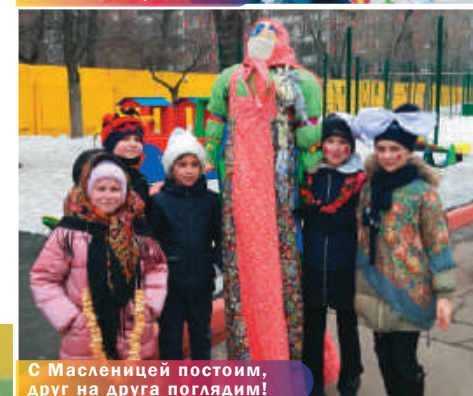
С Масленицей постоим, друг на друга поглядим!