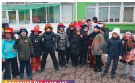
Ведущие! Вы лучшие!