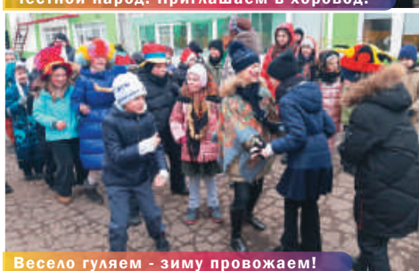
Весело гуляем - зиму провожаем!