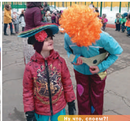
Ну что, споем?!