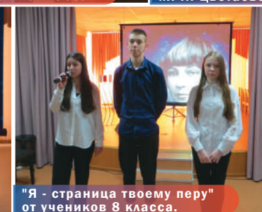
"Я - страница твоему перу" от учеников 8 класса.