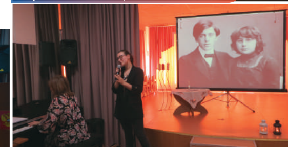
Исполнение романса «Под лаской плюшевого плета» на стихи М. И. Цветаевой от ученицы 11 класса.