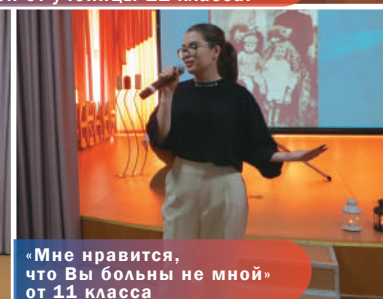
«Мне нравится, что Вы больны не мной» от 11 класса