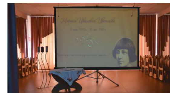
«Болью и счастьем пронзенная жизнь...» литературная гостиная по творчеству Марины Ивановны Цветаевой.