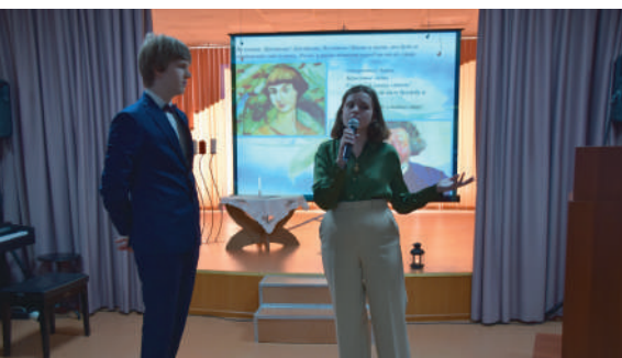
Диалог Максимилиана Волошина и Марины Цветаевой в исполнении учеников 9 «Б» класса.