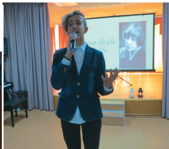
Прочтение красноречивого стихотворения "Молитва" от ученика 8 класса.