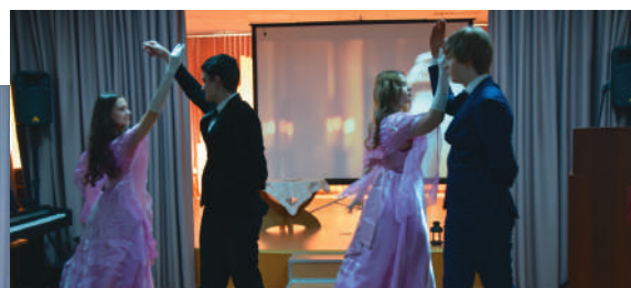
Танцевальная композиция на песню «Я тебя отвоюю...» от учеников 10 класса.