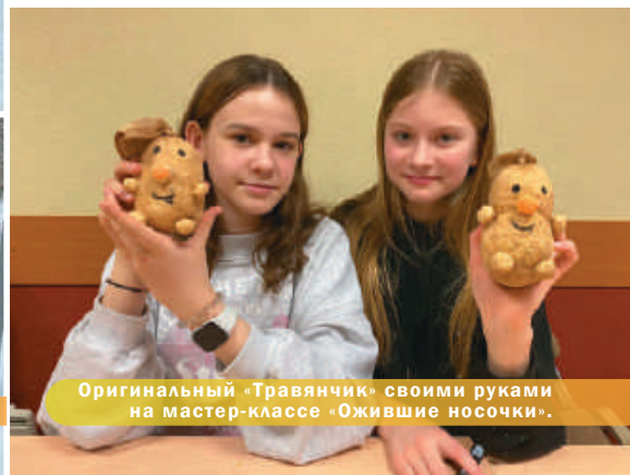
Оригинальный «Травяничок» своими руками на мастер-классе «Ожившие носочки».

Можно было поиграть с друзьями в «Казачи-разбойники», «Мега-вышибалы», «Мафию», «Выше ножки от земли», «Пиявочки», принять участие в спортивно-стратегической игре «Знамя», квестах