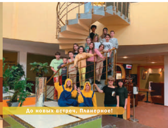
До новых встреч, Планерное!

с элементами тимбилдинга и «Следопыты», посмотреть фильм «Полианна», сделать яркий аквагрим или научиться новым творческим приемам и креативно подойти к любому заданию. Юные исследователи искали «Чей след» на прогулке, шли «След за следом» на интерактивной игре, играли в «Светофор» на свежем воздухе. На интерактивных программах «Самый умный», «Угадай мелодию» была возможность открыть для себя много нового и интересного. Ребятам ждали за эту неделю творческие мастер-классы «Шаромоделирование», «Ожившие носочки», «Волшебный журавлик», «Бисероплетение», «Подарок маме», «Шпионская открытка».