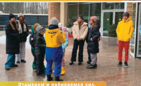
Отдыхаем и набираемся сил.