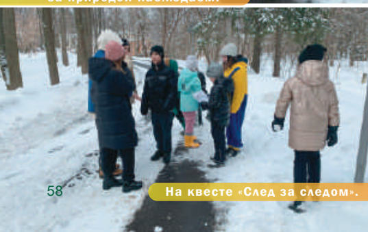
На квесте «След за следом».

Активный отдых на весенних каникулах - неотъемлемая часть жизни школы «САМСОН». Он делает школьную жизнь ярче, интересней и счастливее, помогает ребенку развиваться, с пользой проводить досуг в кругу своих друзей. Это возможность после долгой зимы с пользой отдохнуть, набраться сил, хорошо окончить учебный год.