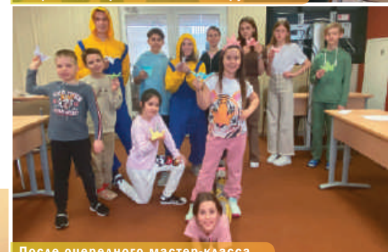
После очередного мастер-класса.