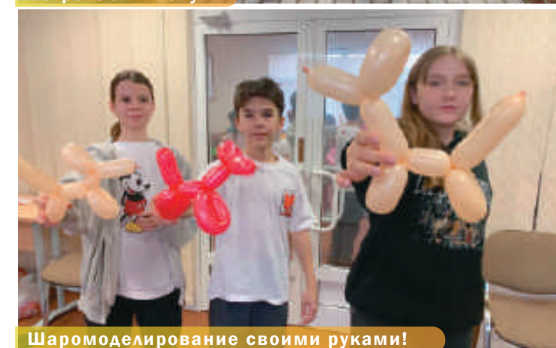
Шаромоделирование своими руками!