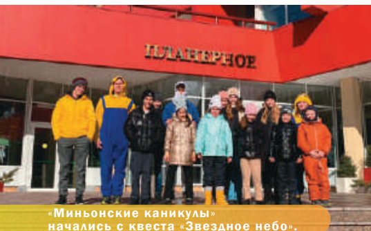
«Миньонские каникулы» начались с квеста «Звездное небо».