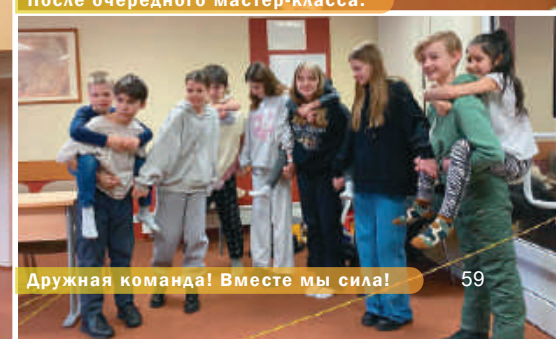
Дружная команда! Вместе мы сила!