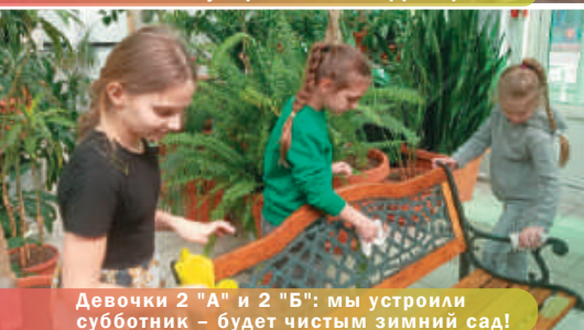
Девочки 2 "А" и 2 "Б": мы устроили субботник – будет чистым зимний сад!