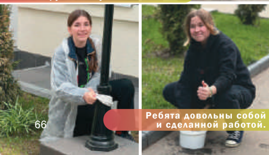
Ребята довольны собой и сделанной работой.