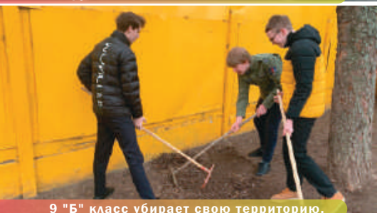
9 "Б" класс убирает свою территорию.