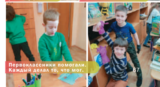
Первоклассники помогали. Каждый делал то, что мог.