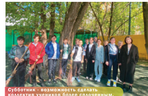
Субботник – возможность сделать коллектив учеников более сплоченным.

Школа – наш дом, где всегда тепло и уютно. Наши ученики доказали это во время весеннего общешкольного субботника. Так держать!