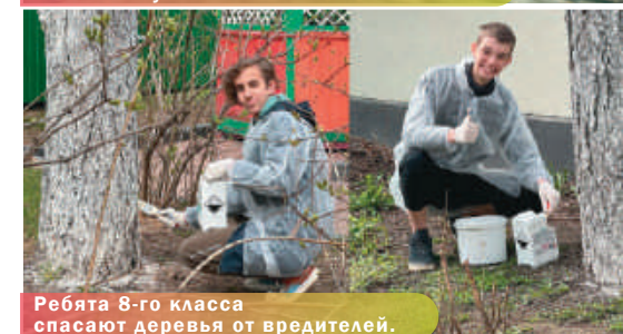
Ребята 8-го класса спасают деревья от вредителей.