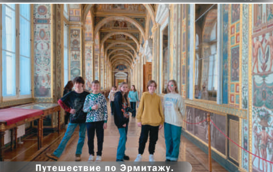
Путешествие по Эрмитажу.