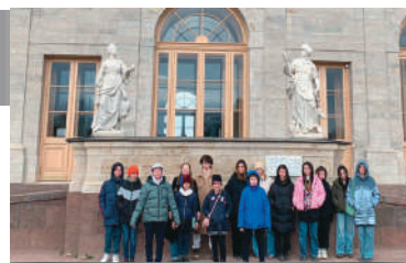
При входе в Гатчинский Дворец.

Второй день путешествия ознаменовался посещением Кунсткамеры - первого публичного музея России, основанного Петром I, где собраны уникальные естественнонаучные и этнографические коллекции, рассказывающие о человеке и разных народах мира. Наше путешествие по городу продолжилось эпохой императора-романтика Павла I в Гатчин-