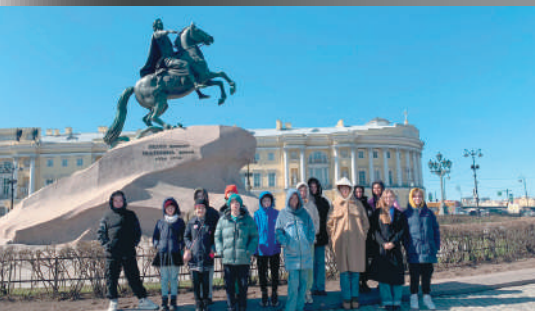
На Сенатской площади, у памятника Петру I.