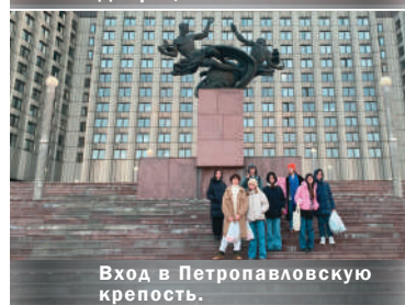
Вход в Петропавловскую крепость.