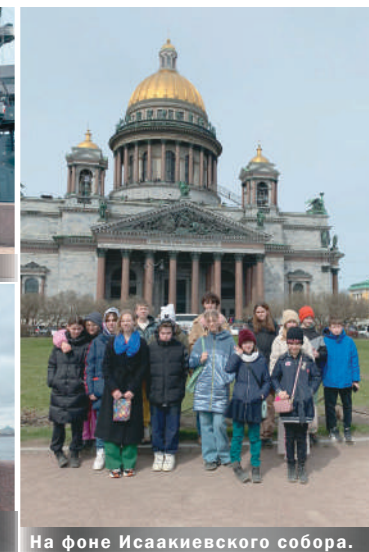
На фоне Исаакиевского собора.

ском дворце. Живописные пейзажи, тишина, изобилие водоемов - все это придает дворцово-парковому комплексу особое очарование. И уже не кажется удивительным, что именно здесь предпочитал жить самый романтичный и мечтательный российский император. Память о нем хранит Гатчинский дворец, за скромными фасадами которого скрыты роскошные интерьеры и знаменитый подземный ход к Серебряному озеру, где можно услышать свое эхо.