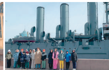
Легендарный крейсер "Аврора".