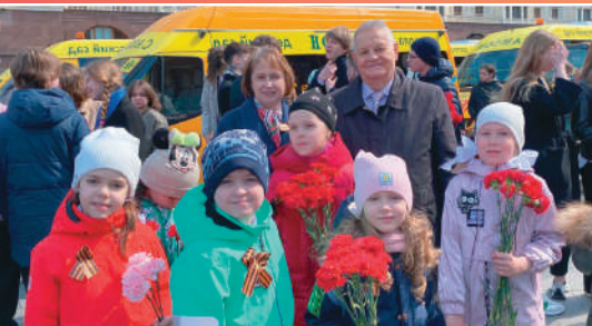
Ученики школы «САМСОН» прибыли на Красную площадь.