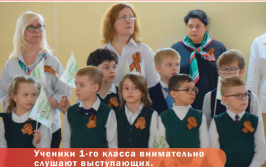
Ученики 1-го класса внимательно слушают выступающих.