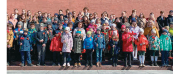
Вечная благодарность и память! Общее фото у Кремлевской стены.