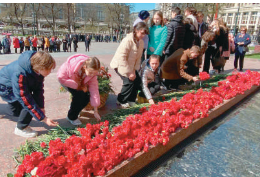
Возлагаем цветы к Могиле Неизвестного Солдата.