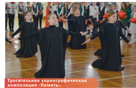
Трогательная хореографическая композиция «Память».